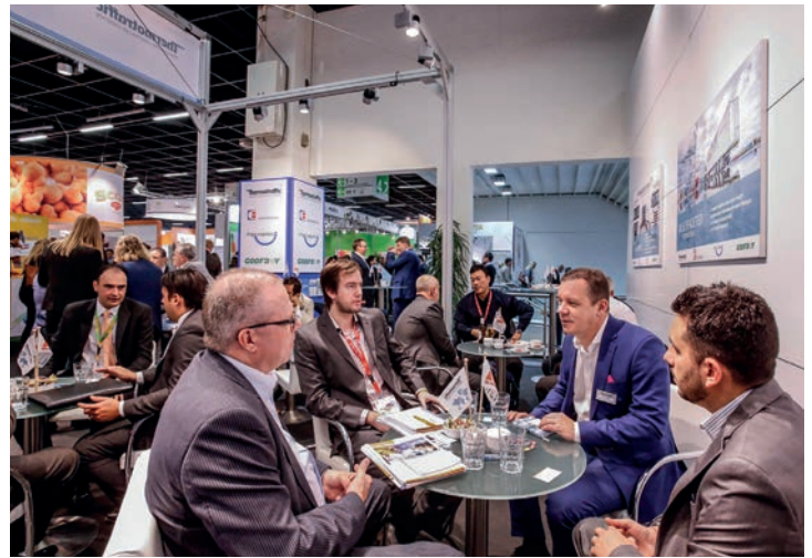
Anuga-Stand in Köln/Anuga stand in Cologne

•• Mitte Oktober präsentierte sich Thermottraffic mit einem eigenen Stand auf der Anuga in Deutschland. Rund 160.000 Fachbesucher aus 192 Ländern besuchten die weltweit führende Ernährungsmesse in Köln. Das internationale Thermottraffic-Messteam informierte die Standbesucher über globale, maßgeschneiderte Kühllogistiklösungen für die Lebensmittelindustrie. Im Fokus standen hierbei insbesondere logistische Dienstleistungen für Übersee- und Landtransporte.