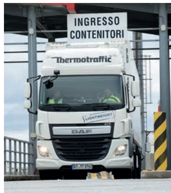
Zertifizierte Übersee- und Landtransporte/ Certified overseas and road transportation

•• Thermotraffic ist nach ISO 22000 auditiert worden. Das Rotterdamer Unternehmen erhält damit zum zweiten Mal das Zertifikat von der unabhängigen Zertifizierungsstelle Kiwa Nederland B.V. Die ISO gewährleistet auf Basis eines international einheitlichen Bewertungssystems Transparenz entlang der gesamten Supply Chain. Thermotraffic erfüllt die Anforderungen für den nationalen und internationalen Transport von temperaturgeführten Lebensmitteln und stellt ein entsprechendes Qualitätsmanagement sicher. Die ISO 22000 gilt für alle Verkehrsträger und alle Produkte, unabhängig davon, ob sie gefroren, gekühlt oder ungekühlt transportiert werden.