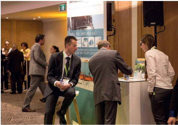
Juice Summit in Antwerpen/Juice Summit in Antwerp

•• Erstmals hat Thermottraffic im Oktober die Juice-Summit-Jahreskonferenz in Belgien gesponsert und sich dort mit einem Informationsstand präsentiert. Die Veranstaltung ist ein jährliches Zusammentreffen von Entscheidungsträgern der weltweiten Saftindustrie sowie deren Zulieferern in Antwerpen. Die Teilnahme an der Tagung nutzte Thermottraffic, um über seine logistischen Dienstleistungen im Bereich der Saftlogistik zu informieren. Insgesamt nahmen rund 500 Teilnehmer an dem Kongress teil.