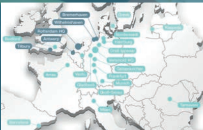
NEUE STANDORTE NEW LOCATIONS