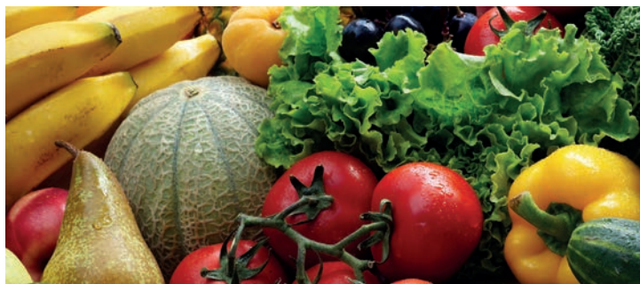
Frische Lebensmitteltransporte/Fresh food transportation

•• Im Juni hat das unabhängige LACON Institut Thermotraffic die erfolgreiche Auditierung mit dem EU-Bio-Zertifikat bestätigt. Die Beurteilung gilt für den Import, den Transport und die Lagerung ökologisch erzeugter Lebensmittel sowie das Qualitätsmanagement. Die Einhaltung der Normen nach Biostandard und die Überprüfung durch eine unabhängige Stelle ist für das Unternehmen von großer Bedeutung.