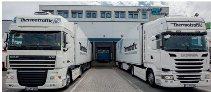
Perishable Center Frankfurt am Main/Perishable Center Frankfurt/Main

•• Seit März ist die Thermotraffic mit einem eigenen Büro am Frankfurter Flughafen im Perishable Center präsent. Dafür hat das Unternehmen in das Equipment seiner Lkw-Flotte investiert und die Auflieger mit einem speziellen Rollenbett für den Transport von Luftfracht ausgestattet. Bei der Be- und Entladung von Frachtgut auf Flugzeugblechen oder in Containern ist so eine schnellere Abwicklung möglich und die Standzeiten können verkürzt werden. Durch die direkte Anbindung an den Frankfurter Flughafen werden Luftfracht-sendungen wie Obst, Gemüse, Fisch, Fleisch und Medikamente als palettierte oder auch als lose Ware schnell vom Flugzeug in die bereitstehenden Auflieger am Perishable Center verladen. Von dort werden die Produkte auf direktem Weg in Kühlaufliegern zu allen europäischen Destinationen transportiert.